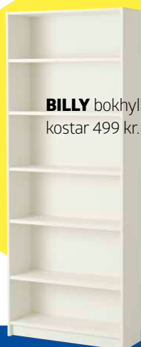
BILLY bokhylla kostar 499 kr.

Om du sätter ihop flera hyllor blir det snyggast om du ställer dem på socklar